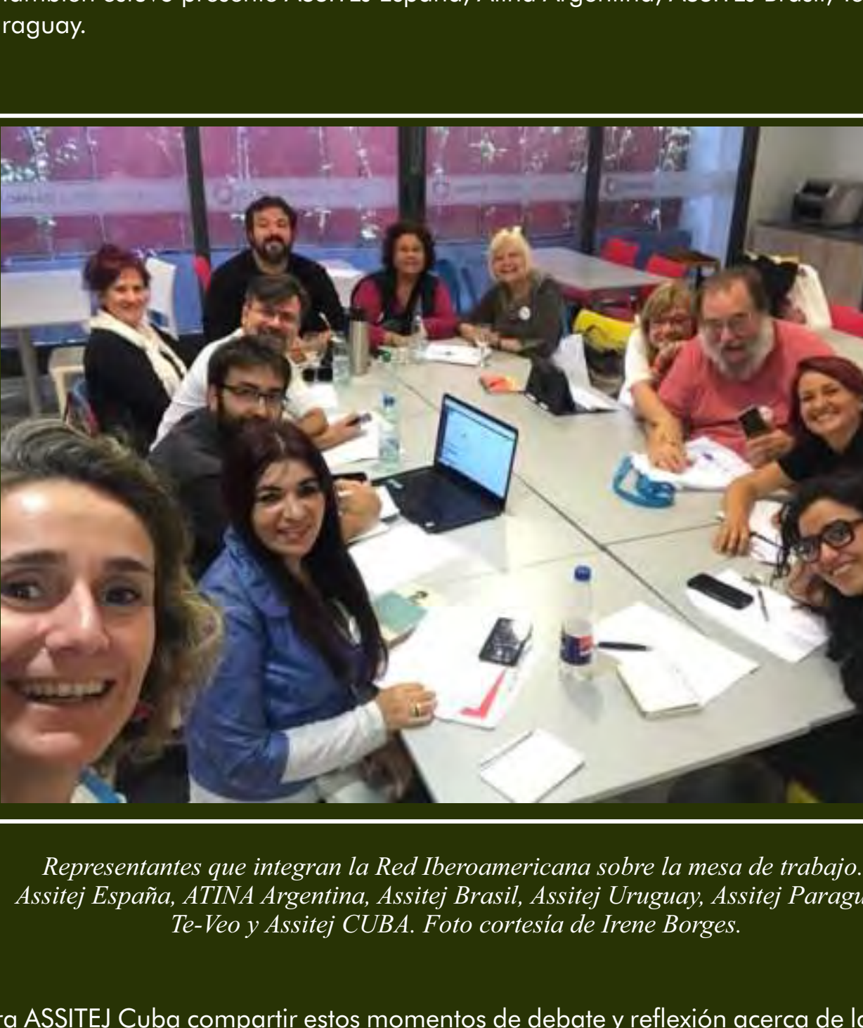
Títere de hielito de Teatro Viajero. Foto cortesía del propio grupo

Teatro Viajero se ha presentado en diferentes escenarios nacionales e internacionales. Ha recibido varios reconocimientos y premios por su labor artística. Cuenta con la Distinción Raúl Gómez García.